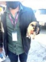
TIJUANA. El Gobierno Municipal busca la protección de la fauna de la localidad, impidiendo la venta indiscriminada de las mascotas de manera clandestina.

TIJUANA. El XXIII Ayuntamiento de Tijuana, a través de la Dirección de Inspección y Verificación, en coordinación con la Policía Comercial, llevaron a cabo el decomiso de tres cachorros castrados en las inmediaciones de la Garita Internacional de San Ysidro durante el fin de semana, en cumplimiento a la indicación del presidente municipal, Arturo González Cruz, de poner orden en el comercio de la zona y evitar este tipo de prácticas irregulares, que se agudizaron tras varios reportes ciudadanos.