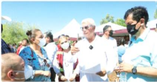
SAN FELIPE. El Gobernador Jaime Bonilla recorrió las jornadas ciudadanas. Ayer estuvo en San Felipe y anunció que será municipio, que hoy trabaja en su creación en el Congreso del Estado y será punto de partida para su mejor desarrollo.

SAN FELIPE. En el marco de una Jornada Ciudadana, el gobernador de Baja California, Jaime Bonilla Valdez, personalmente le dio seguimiento tanto al tema de las obras en proceso que realiza el Estado, así como a lo relacionado a la municipalización de San Felipe, un asunto que varias administraciones dejaron en el olvido y que